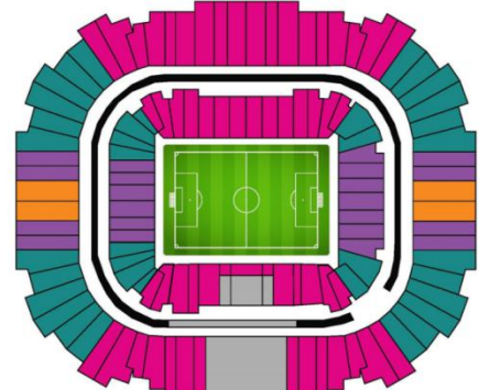
Saint Petersburg - Saint Petersburg Stadium