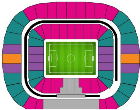
Moscow - Luzhniki Stadium

行程已包含两场比赛场次球票（球票等级以本行程首页“观看场次”标注为准），如需升级请联系客服。 球票价格会因比赛热度和时间推移而产生波动，请旅客报名前和工作人员落实球票是否需要补差。